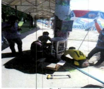
ฝ่ายงานสถานที่ อาคารหลังที่ ๑ ติดตั้งอ่างล้างมือ เพื่อบริการนักท่องเที่ยว บริเวณด้านหน้าตู้จำหน่ายบัตร