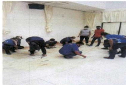
ฝ่ายงานสถานที่ อาคารหลังที่ ๓ ล้างทำความสะอาดพื้นทางเดินภาพวาด บริเวณด้านหน้าอาคาร