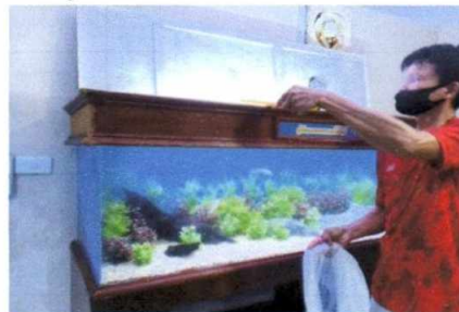
ปลา และจระเข้ อาคารหลังที่ ๒ แก้ไขระบบท่อน้ำตู้ปลาทรงกระบอก และตู้ปลาช่อนยักษ์เมซอน