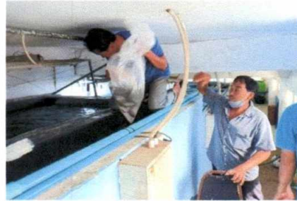
ปลา และจระเข้ อาคารหลังที่ ๒ ทำการเปลี่ยนถ่ายน้ำ และล้างถังกรองบ่อปลาคราฟ