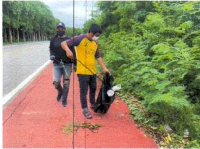
ฝ่ายงานสถานที่ อาคารหลังที่ ๑ เก็บขยะ บริเวณโดยรอบทางเข้าบึงฉวากเฉลิมพระเกียรติฯ