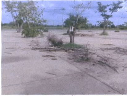
ฝ่ายงานสถานที่ อาคารหลังที่ ๑ ตัดต้นไม้ที่ตาย บริเวณลานจอดรถฝั่งประปา