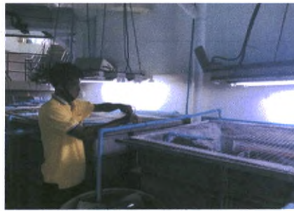
ฝ่ายงานสถานที่ อาคารหลังที่ ๓ ทำการแก้ไขท่อส่งน้ำจืด สำหรับใช้งานภายในอาคาร