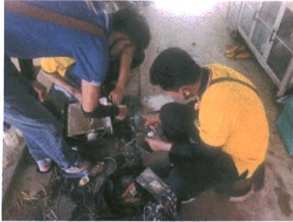
ฝ่ายงานสถานที่ อาคารหลังที่ ๑ แกะไขคอมพิวเตอร์ บ่อที่ขุดที่ชำรุด