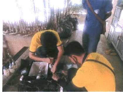
ฝ่ายงานสถานที่ อาคารหลังที่ ๒ แกะไขปลั๊กไฟระบบกรองตู้ปลาเฉียวหิน ที่ชำรุด