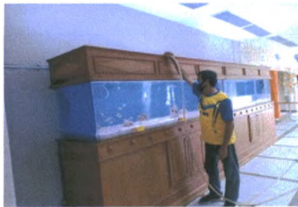
ปลา และจระเข้ อาคารหลังที่ ๒ ล้างทำความสะอาดตู้ปลา และดำน้ำทำความสะอาดอุโมงค์ปลา