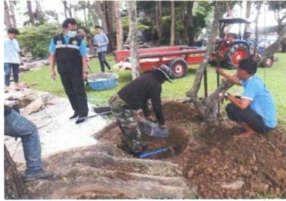
ฝ่ายงานสถานที่ อาคารหลังที่ ๑ ขุดบ่อทำธนาคารน้ำใต้ดิน บริเวณสวนหย่อมบ่อปลากราฟ