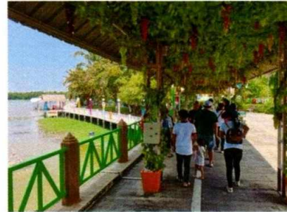
ตรวจติดตามงานสถานแสดงพันธุ์สัตว์น้ำบึงฉวาก วันที่ ๓๐ สิงหาคม ๒๕๖๓