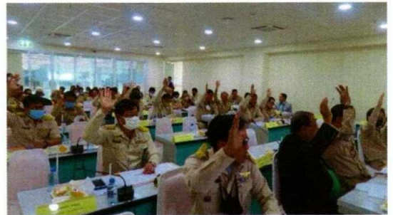
ประชุมสภา อบจ.สุพรรณบุรี สมัยสามัญ สมัยที่ ๒ ครั้งที่ ๒ ประจำปี ๒๕๖๓ วันที่ ๒๕ สิงหาคม ๒๕๖๓