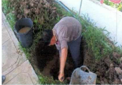
ฝ่ายงานสถานที่ อาคารหลังที่ ๑ ขุดบ่อทำธนาคารน้ำใต้ดิน บริเวณทางเดินด้านหน้าทางเข้า