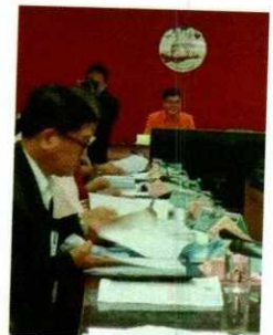
ประชุมคณะกรรมการบริหารงานจังหวัดแบบบูรณาการ (กบจ.) วันที่ ๑๑ กันยายน ๒๕๖๓ ณ ห้องประชุมขุนแผน ศาลากลางจังหวัดสุพรรณบุรี