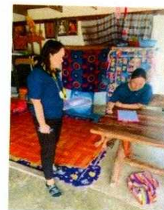
ลงพื้นที่ประเมินผลโครงการปรับปรุงคันกันน้ำโดยถมดินเสริมคันบดอัดแน่น (ช่วงที่ ๕) หมู่ที่ ๖ ตำบลบ้านโพธิ์ เริ่มจากลาดไถนด เต่าอิฐ เข้มเขต หมู่ที่ ๔ ตำบลโพธิ์พระยา อำเภอเมือง