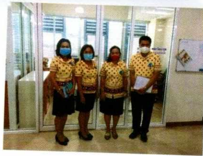
รับตรวจประเมินผลการปฏิบัติกิจกรรม ๕ ส ประจำเดือน สิงหาคม ๒๕๖๓ วันที่ ๙ กันยายน ๒๕๖๓