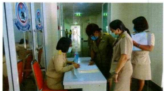
ประชุมสภา อบจ.สุพรรณบุรี สมัยสามัญ สมัยที่ ๒ ครั้งที่ ๓ ประจำปี ๒๕๖๓ วันที่ ๑๔ กันยายน ๒๕๖๓ ณ ห้องประชุม ๓ ข้างห้องรองปลัด อบจ.สุพรรณบุรี