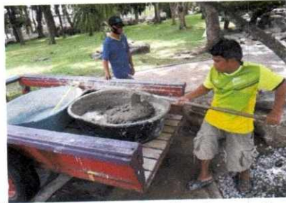
ฝ่ายงานสถานที่ อาคารหลังที่ ๑ ทำการเทพื้นทางเดิน บริเวณสวนหย่อมบ่อปลากราฟ