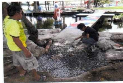
ฝ่ายงานสถานที่ อาคารหลังที่ ๒ ผู้รับจ้างเข้ามาทาสีทางเดินภายในบ่อจระเข้ ตามสัญญาจ้าง