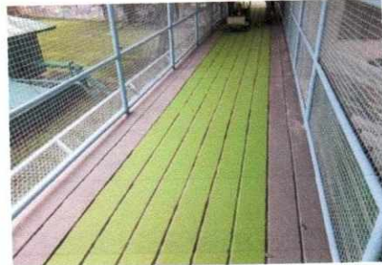
ฝ่ายงานสถานที่ อาคารหลังที่ ๓ บริษัทเข้ามาล้างทำความสะอาดแผ่นเพททซีท