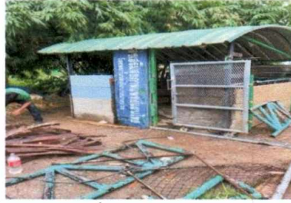
ฝ่ายงานสถานที่ อาคารหลังที่ ๑ จัดทำสถานที่สำหรับพักขยะ บริเวณด้านหลังโรงเพาะฟัก