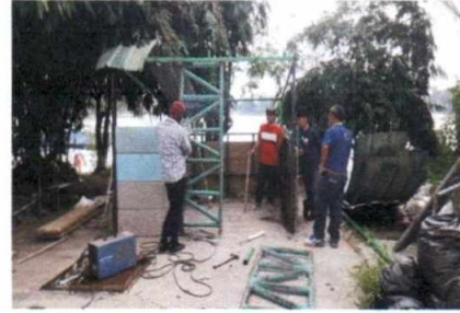
ฝ่ายงานสถานที่ อาคารหลังที่ ๒ บริษัทเข้ามาปรับปรุงบริเวณบ่อจระเข้ ตามสัญญาจ้าง