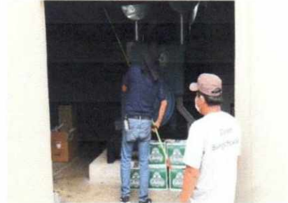
ฝ่ายงานสถานที่ อาคารหลังที่ ๓ บริษัทเข้ามาดูแลบำรุงรักษาเครื่องปรับอากาศภายในอาคารประจำเดือน ตามสัญญาจ้าง