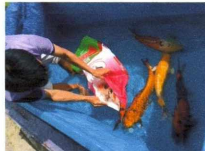
ปลา และจระเข้ อาคารหลังที่ ๒ ล้างถังกรองน้ำ บริเวณบ่อปลาบึก