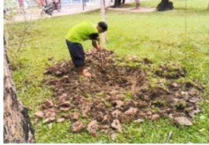
ฝ่ายงานสถานที่ อาคารหลังที่ ๑ ขุดบ่อทำธนาคารน้ำใต้ดิน บริเวณสวนหย่อมบ่อปลากราฟ