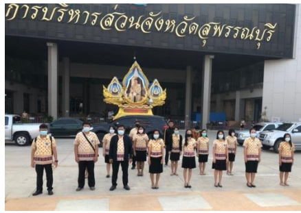
เคารพธงชาติหน้าเสาธงองค์การบริหารส่วนจังหวัดสุพรรณบุรี