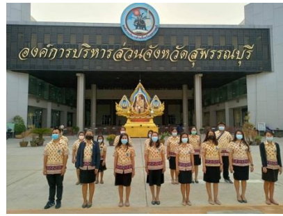
เคารพธงชาติหน้าเสาธงองค์การบริหารส่วนจังหวัดสุพรรณบุรี