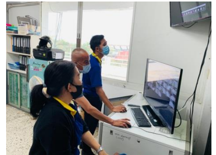
ออกพื้นที่ตรวจงานจ้างเหมาบำรุงรักษาล้องโทรทัศน์วงจรปิด CCTV ณ อำเภอบางปลาม้า