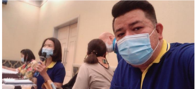
ประชุมใหญ่สามัญหอการค้า ครั้งที่ ๓๗ ประจำปี ๒๕๖๔ วันที่ ๑๘ มีนาคม ๒๕๖๔ ณ โรงแรมสองพันบุรี