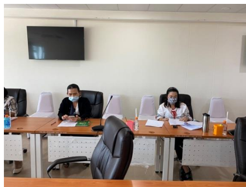
ประชุมคณะกรรมการจัดทำตัวชี้วัดและกลั่นกรองการประเมินประสิทธิภาพและประสิทธิผลการปฏิบัติราชการ เพื่อกำหนดประโยชน์ตอบแทนอื่นกรณีพิเศษ