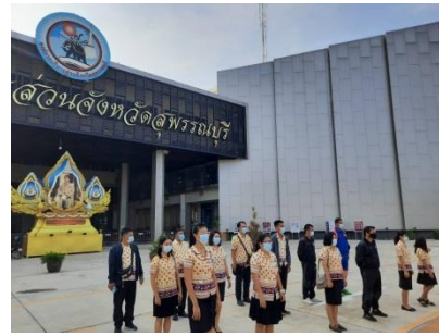
เคารพธงชาติหน้าเสาธงองค์การบริหารส่วนจังหวัดสุพรรณบุรี