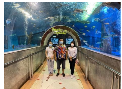
ตรวจติดตามงานบริหารจัดการสถานแสดงพันธุ์สัตว์น้ำบึงฉวาก วันที่ ๔ พฤษภาคม ๒๕๖๔