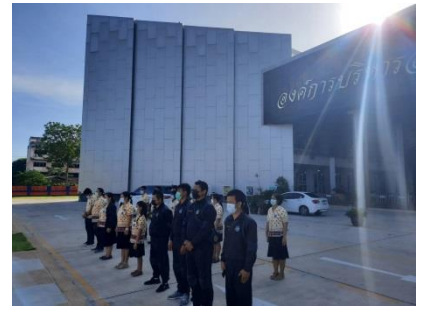
เคารพธงชาติหน้าเสาธงสำนักงานองค์การบริหารส่วนจังหวัดสุพรรณบุรี