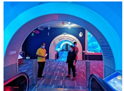
ตรวจติดตามงานบริหารจัดการสถานแสดงพันธุ์สัตว์น้ำบึงฉวาก วันที่ ๓ มิถุนายน ๒๕๖๔