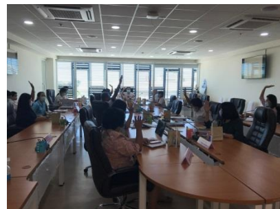
ประชุมคณะกรรมการสนับสนุนการจัดทำแผนพัฒนาเพื่อพิจารณา ร่างแผนพัฒนาท้องถิ่น (พ.ศ. ๒๕๖๑ - ๒๕๖๕) เพิ่มเติม ครั้งที่ ๑๑