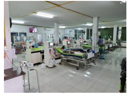
ดูงานเรื่อง ศูนย์พอกไต ณ สำนักงานเทศบาลเมืองชัยภูมิ