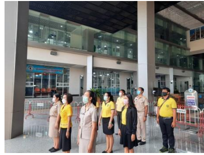
เคารพธงชาติหน้าเสาธงสำนักงานองค์การบริหารส่วนจังหวัดสุพรรณบุรี