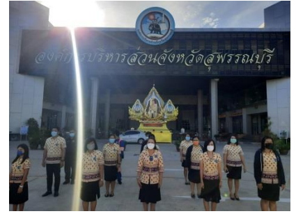
เคารพธงชาติหน้าเสาธงสำนักงานองค์การบริหารส่วนจังหวัดสุพรรณบุรี