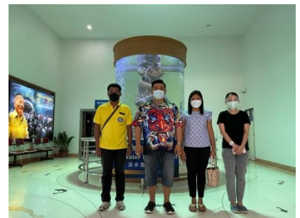
ตรวจติดตามงานสถานแสดงพันธุ์สัตว์น้ำบึงฉวากเฉลิมพระเกียรติฯ