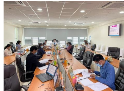
ประชุมคณะกรรมการพัฒนา อบจ.สุพรรณบุรี เพื่อพิจารณาวางแผนพัฒนาท้องถิ่น (พ.ศ. ๒๕๖๑ - ๒๕๖๕) เพิ่มเติม ครั้งที่ ๑๑