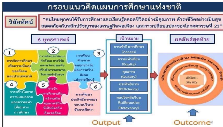
แผนภาพ ๘ กรอบแนวคิดแผนการศึกษาแห่งชาติ

ยุทธศาสตร์ ประกอบด้วย ๖ ยุทธศาสตร์ ที่เกี่ยวข้องกับการพัฒนาการศึกษาในพื้นที่ภาคกลางปลัดกระทรวงศึกษาธิการทั้ง ๖ ยุทธศาสตร์ ดังนี้