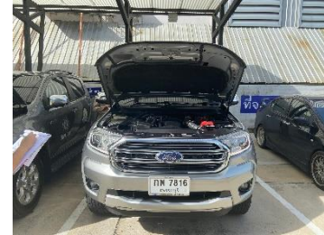
ดำเนินการเข้ารับการตรวจสภาพรถยนต์ส่วนกลางกองยุทธศาสตร์ และงบประมาณ ณ หน้าที่สำนักงานองค์การบริหารส่วนจังหวัดสุพรรณบุรี