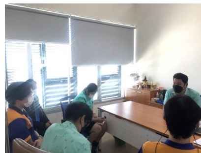
ดำเนินการมอบหมายการปฏิบัติหน้าที่ให้กับพนักงานจ้างที่ได้รับการบรรจุใหม่ จำนวน ๕ ราย