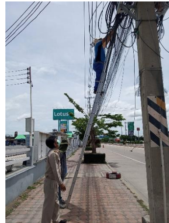
ดำเนินการชี้จุดติดตั้งกล้องโทรทัศน์วงจรปิด (CCTV) ในเขตพื้นที่อำเภอเมืองสุพรรณบุรี