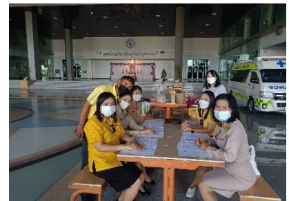
ดำเนินการจัดบันทึกอุณหภูมิร่างกายของข้าราชการ พนักงานจ้าง จ้างเหมา ของอบจ.สุพรรณบุรี