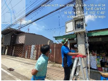
ดำเนินการตรวจติดตามโครงการจ้างเหมาบำรุงรักษาระบบกล้องโทรทัศน์วงจรปิด CCTV ในเขตพื้นที่ อ.ศรีประจันต์ อ.ดอนเจดีย์ อ.หนองงูเหลือม อ.สองพี่น้อง จ.สุพรรณบุรี