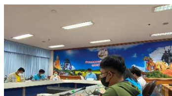
ดำเนินการเข้าร่วมประชุมคณะทำงานพิจารณากลับกรองโครงการจัดหาระบบ คอมพิวเตอร์ของหน่วยงานในสังกัดกระทรวงมหาดไทยจังหวัดสุพรรณบุรี ครั้งที่ ๒ ๒๕๖๕ วันที่ ๒ กันยายน ๒๕๖๕ ณ ห้องประชุม MC ชั้น ๔ ศาลากลาง จังหวัดสุพรรณบุรี