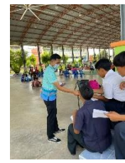
ดำเนินการลงพื้นที่ติดตามและประเมินผลโครงการแข่งขันกีฬาเซปักตะกร้อเยาวชนเงินล้าน อบจ.สุพรรณบุรี ลีคัพ ปีที่ ๗ ประจำปี ๒๕๖๕