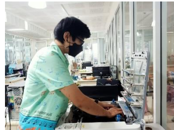
ดำเนินการซ่อมบำรุงดูแลรักษาเครื่องคอมพิวเตอร์/เครื่องปริ้นเตอร์/ลงโปรแกรม, เซิร์ฟเวอร์โทรศัพท์ กองพัสดุและทรัพย์สิน,หน่วยตรวจสอบภายใน, ห้องประชาสัมพันธ์, กองสาธารณสุข, สำนักปลัดฯ, สำนักเลขานุการ, ห้องประชุมสภาฯ, ห้องประชุมข้างห้องนายกฯ, กองพัสดุฯ, กองการศึกษา และห้องกองการเจ้าหน้าที่