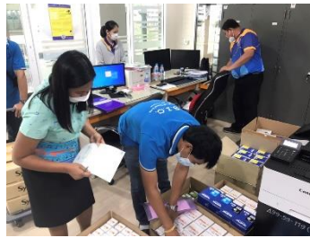
ดำเนินการตรวจรับอุปกรณ์คอมพิวเตอร์ หมึกปริ้นเตอร์ และแบตเตอรี่