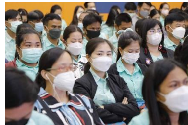
เข้าร่วมประชุมประจำเดือนสิงหาคม ๒๕๖๕ ของข้าราชการ ลูกจ้าง และพนักงานจ้างของอบจ.สุพรรณบุรี ณ หอประชุมองค์การบริหารส่วนจังหวัดสุพรรณบุรี