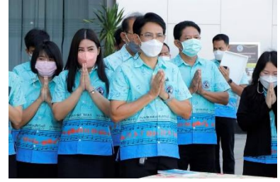
เข้าร่วมทำบุญตักบาตรประจำเดือนสิงหาคม ๒๕๖๕ ของข้าราชการ ลูกจ้าง และพนักงานจ้างของอบจ.สุพรรณบุรี ณ บริเวณหน้าสำนักงานองค์การบริหารส่วนจังหวัดสุพรรณบุรี