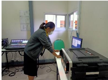
ดำเนินการควบคุมระบบคอมพิวเตอร์ และเครื่องเสียง ในการประชุมประจำเดือนสิงหาคม วันที่ ๓๑ สิงหาคม ๒๕๖๕ ณ หอประชุมใหญ่ องค์การบริหารส่วนจังหวัดสุพรรณบุรี