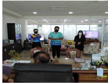
ดำเนินการเข้าแนะนำแอมบาสเตอร์โครงการ Smart City ประจำสำนักงาน อบจ.สุพรรณบุรี กับท่านนายกบุญชู จันทร์สุวรรณ วันที่ ๑ กันยายน ๒๕๖๕ ณ ห้องนายกองค์การบริหารส่วนจังหวัดสุพรรณบุรี