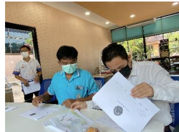
ดำเนินการบริการให้ความรู้ทางวิชาการด้านระบบกล้องโทรทัศน์วงจรปิด CCTV ณ องค์การบริหารส่วนตำบลทับตีเหล็ก