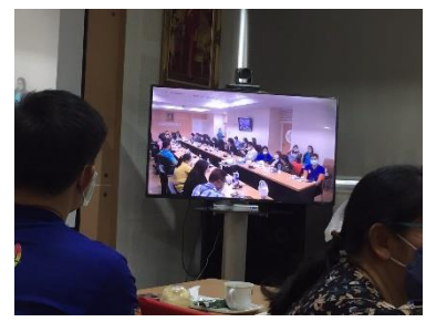
เข้าร่วมโครงการ “การพัฒนาต้นแบบระบบสุขภาพปฐมภูมิขององค์การบริหารส่วนจังหวัดและแนวทางการขับเคลื่อนการบูรณาการความร่วมมือระหว่างหน่วยงานและการมีส่วนร่วมของประชาชน” ณ สำนักงานประกันสุขภาพแห่งชาติ เขต ๕ ราชบุรี