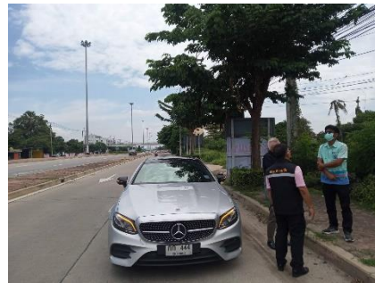
ให้บริการทางวิชาการ เรื่อง กล้องโทรทัศน์วงจรปิด (CCTV) ณ องค์การบริหารส่วนตำบลสนามชัย