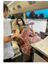
เข้าร่วมบุคลากรกองยุทธศาสตร์ และงบประมาณเข้าร่วมบริจาคโลหิตกับสภากาชาดไทย (รพ.เจ้าพระยายมราช)