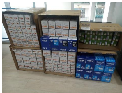
ดำเนินการร่วมตรวจรับวัสดุเกี่ยวกับอุปกรณ์คอมพิวเตอร์ หมึกปริ้นเตอร์ และแบตเตอรี่