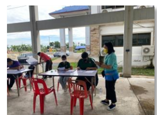
ดำเนินการลงพื้นที่ประเมินโครงการให้การสนับสนุนเครื่องจักรกลประเภทรถบรรทุกปรับปรุงทาง (รถเกรด) กับองค์การปกครองส่วนท้องถิ่น ประจำปีงบประมาณ ๒๕๖๕ องค์การบริหารส่วนตำบลบางตะเคียน อำเภอสองพี่น้อง