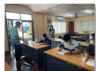
ดำเนินการลงพื้นที่ประเมินโครงการให้การสนับสนุนเครื่องจักรกลประเภทรถบรรทุกปรับปรุงทาง (รถเกรด) กับองค์การปกครองส่วนท้องถิ่น ประจำปีงบประมาณ ๒๕๖๕ องค์การบริหารส่วนตำบลศรีสำราญ อำเภอสองพี่น้อง