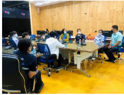
ดำเนินการควบคุมระบบคอมพิวเตอร์ และจอ LED ประชุม รพ.สต.ร่วมกับ กองสาธารณสุข ณ ห้องปฏิบัติการ Conference Room อบจ.สุพรรณบุรี