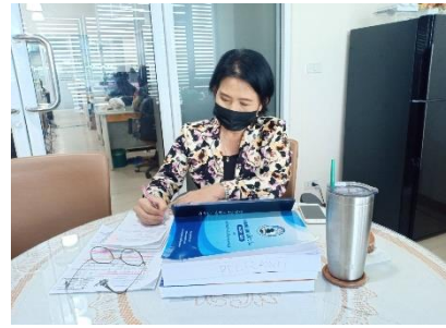
เข้าร่วมประชุมรับฟังความคิดเห็นผลการศึกษารายกระดับการมีส่วนร่วมในการจัดบริการสาธารณะผ่านระบบ Zoom Meeting