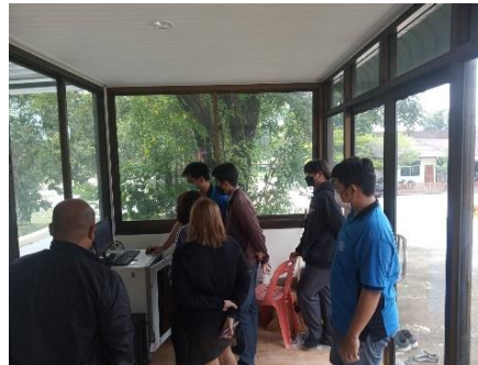
ดำเนินการ บริการให้ความรู้ทางวิชาการด้านระบบกล้องโทรทัศน์วงจรปิด (CCTV) ณ องค์การบริหารส่วนตำบลสระกระโจม