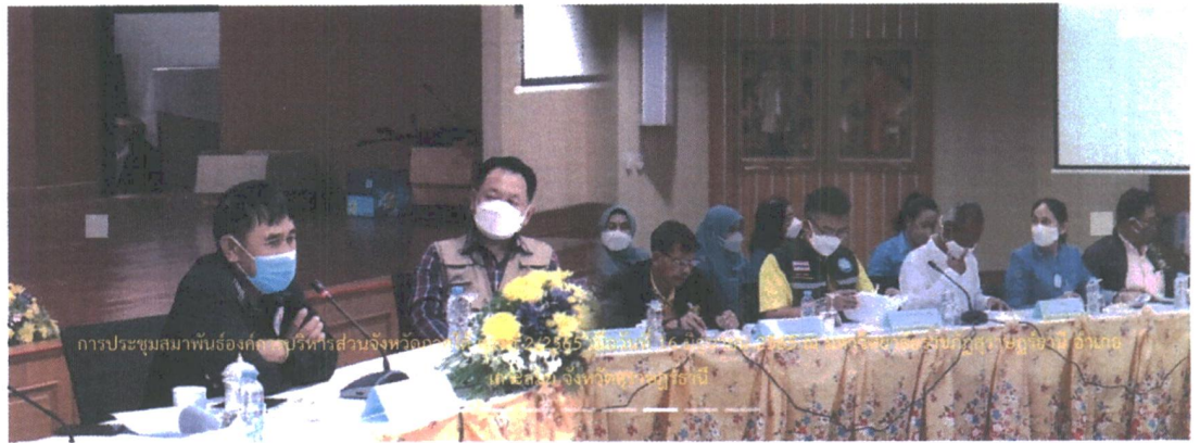
การประชุมสมัชชาองค์กรบริหารส่วนจังหวัดสุพรรณบุรี ครั้งที่ 24 ประจำปีงบประมาณ 2565