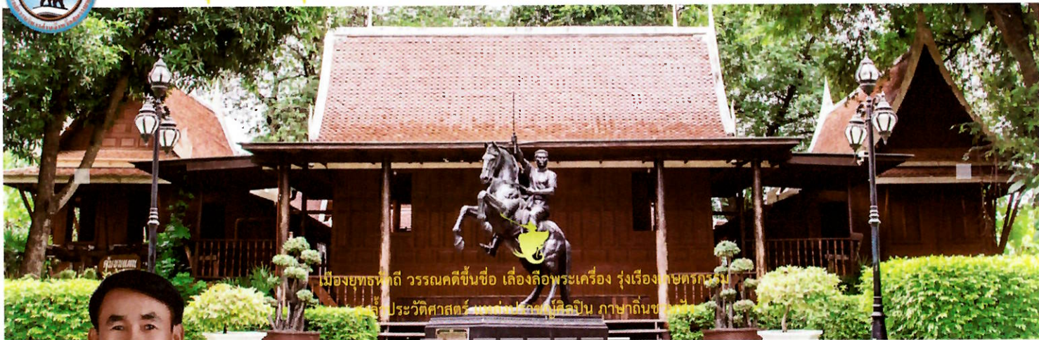
เมืองยุทธหัตถี วรรณคดีขึ้นชื่อ เลื่องลือพระเครื่อง รุ่งเรืองเกษตรกรรม ล้ำประวัติศาสตร์ หมายมั่นโอบอุ้มศิลปิน ภายถิ่นช...