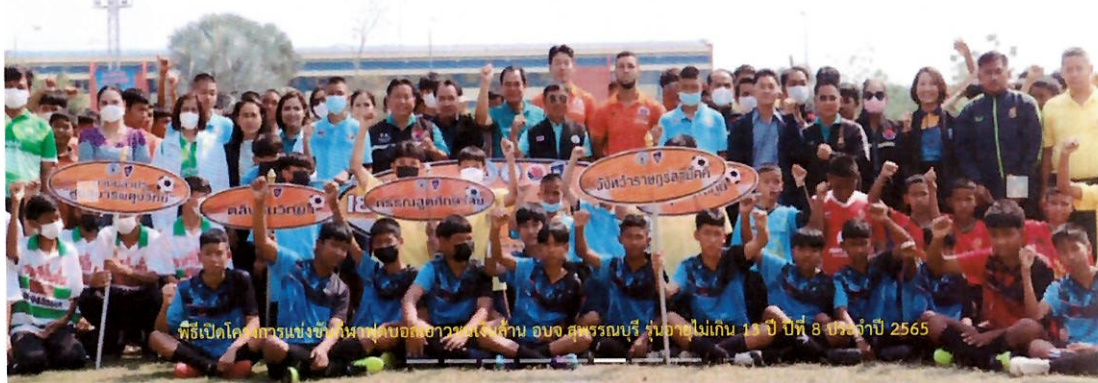
พิธีเปิดโครงการแข่งขันฟุตบอลเยาวชนโรงเรียน อบจ.สุพรรณบุรี รุ่นอายุไม่เกิน 13 ปี ปีที่ 8 ประจำปี 2565