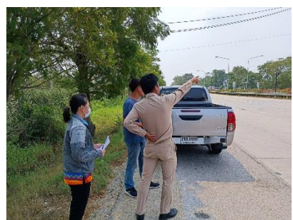
เข้าประชุมร่วมกับผู้กำกับ สก.บางปลาหมอ ในการสำรวจจุดติดตั้งกล้อง อำเภอบางปลาหมอ ตามที่ สก.บางปลาหมอ ได้ขอ การสนับสนุนการกับทาง องค์การบริหารส่วนจังหวัดสุพรรณบุรี