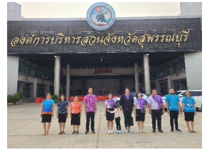
เข้าร่วมกิจกรรมเข้าแถวเคารพธงชาติหน้าเสาธง องค์การบริหารส่วนจังหวัดสุพรรณบุรี