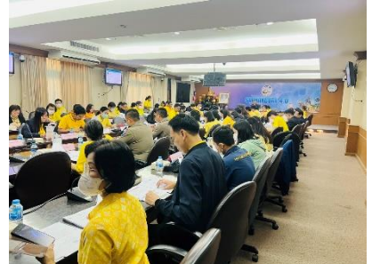
ประชุมคณะกรรมการพัฒนาสถิติระดับจังหวัด จังหวัดสุพรรณบุรี ครั้งที่ ๑/๒๕๖๗ ณ ศาลากลางจังหวัดสุพรรณบุรี