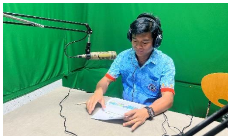
ดำเนินการอัตรายกรวิทยุ เรื่อง การปฏิบัติงานของกองยุทธศาสตร์และงบประมาณ