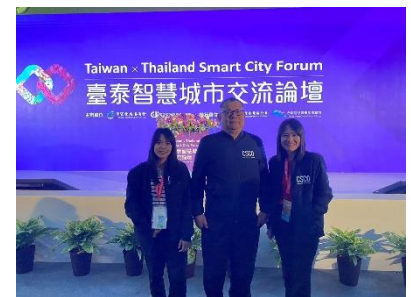
เข้าร่วมงาน Smart City Summit & Expo ๒๐๒๔ Taipei Nangang Exhibition Center Hall ๒ ระหว่างวันที่ ๑๙ - ๒๒ มีนาคม ๒๕๖๗ ณ ประเทศไต้หวัน