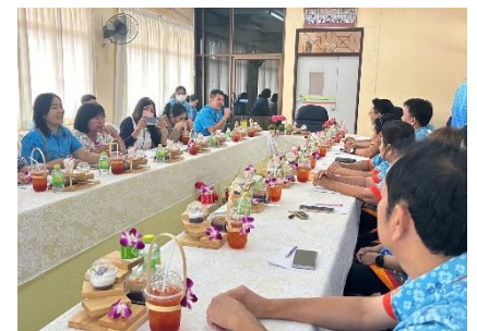
ดำเนินการลงพื้นที่ออกตรวจสอบและให้ข้อเสนอแนะ การปฏิบัติราชการ ของ รพ.สต.อบจ.สุพรรณบุรี ประจำปี พ.ศ.๒๕๖๗ อ.ดอนเจดีย์ (บ้านห้วยม้าลอย) และ อ.สามชุก (บ้านหนองหัวรัง)