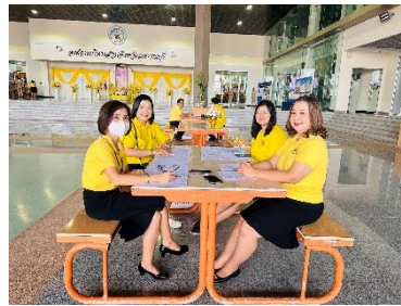
ปฏิบัติหน้าที่จุดวัดอุณหภูมิบุคคลากรขององค์การบริหารส่วนจังหวัดสุพรรณบุรี