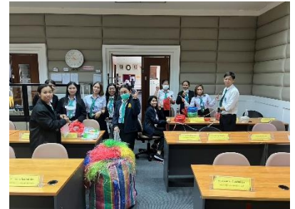
เข้าร่วมอบรมหลักสูตรนักวิเคราะห์นโยบายและแผน รุ่นที่ ๙๗ ณ สถาบันพัฒนาบุคลากรภาพท้องถิ่น ต.คลองหนึ่ง อ.คลองหลวง จ.ปทุมธานี ระหว่างวันที่ ๙ - ๒๙ มีนาคม ๒๕๖๗