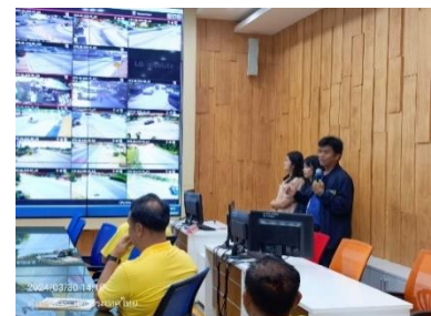
ดำเนินการควบคุมคุณภาพ หอประชุมใหญ่ อบจ.สุพรรณบุรี ชั้น ๑ ต้อนรับคณะศึกษาดูงาน จากองค์การบริหารส่วนจังหวัดพิษณุโลก