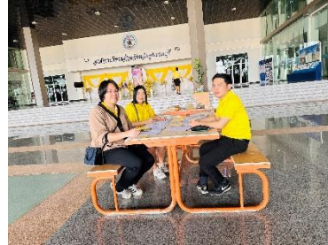
ปฏิบัติหน้าที่จุดควบคุมภูมิบุคลากรขององค์การบริหารส่วนจังหวัดสุพรรณบุรี