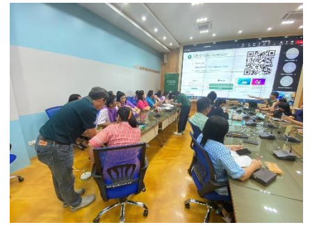
เข้าร่วมอบรมระบบการจองรถยนต์ส่วนกลางขององค์การบริหารส่วนจังหวัดสุพรรณบุรี