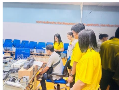
นำเจ้าหน้าที่จากบริษัทพีซีทีเทคโนโลยี จำกัด และคณะกรรมการพิจารณาผลเข้าทำการทดสอบระบบ โครงการจัดซื้อ กล้องโทรทัศน์วงจรปิด (CCTV) และอุปกรณ์พร้อมติดตั้ง รวม ๘๐ จุด ๑๕๖ ตัว