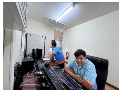
ดำเนินการคุมจอห้องประชุมสภา ชั้น ๓ ประชุมคณะกรรมการกลุ่มพื้นที่สุขภาพ (กพส.) ระดับอำเภอ กองสาธารณสุข