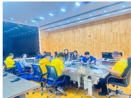
เข้าร่วมประชุมคณะกรรมการตรวจรับประชุมการตรวจรับงานโครงการ ๑๕ ล้านกิโลกรัม จำนวน ๑๓๐ ตัว