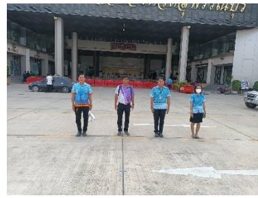
เข้าร่วมกิจกรรมเข้าแถวเคารพธงชาติหน้าเสาธง องค์การบริหารส่วนจังหวัดสุพรรณบุรี