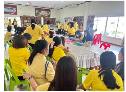
ดำเนินการลงพื้นที่ออกตรวจสอบและให้ข้อเสนอแนะ การปฏิบัติราชการ ของ รพ.สต.อบจ.สุพรรณบุรี ประจำปี พ.ศ.๒๕๖๗ อ.ศรีประจันต์ (มดแดง)