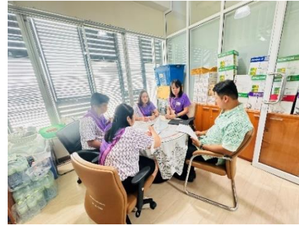
เข้าร่วมประชุมคณะกรรมการกำหนดคุณลักษณะเฉพาะและราคา โครงการกล้องโทรทัศน์วงจรปิด (CCTV) ๑๗ ล้าน จำนวน ๘๐ จุด ๑๕๖ ตัว