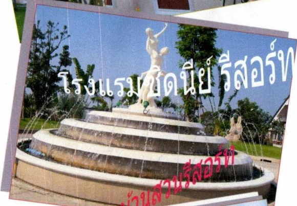
โรงแรมบ้านสวนรีสอร์ท จรีบ้านสุข