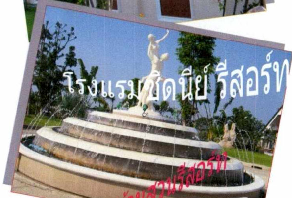
โรงแรมชิตินีย์ รีสอร์ท