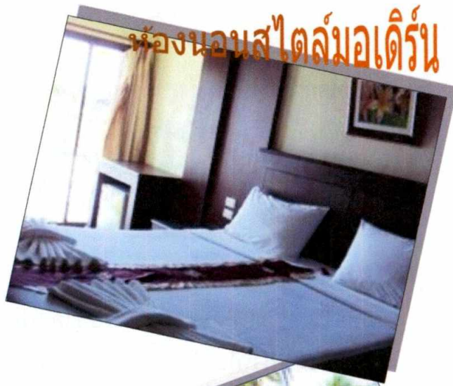
ห้องนอนสไตล์มอเดิร์น