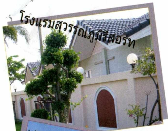
โรงแรมสวรรค์ภูนิริสอร์ท