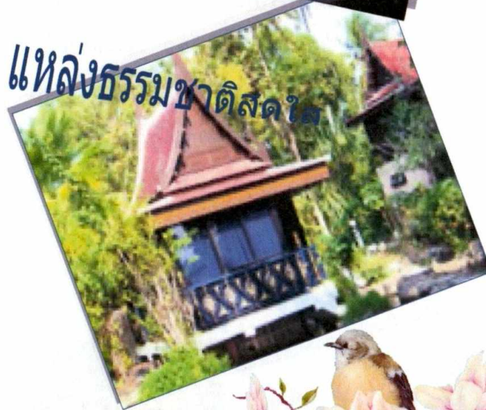
แหล่งธรรมชาติสดใ